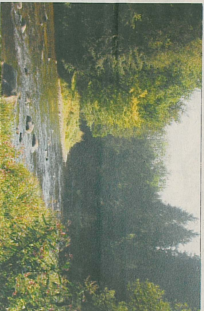
Die Ilz – tief eingeschnittene Schluchten und lichtdurchflutete Wiesen...

Ruderting Passauer Str. 11 Tel. 08509/936182